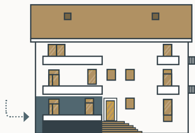
Umístění apartmánu: VÝCHODNÍ POHLED